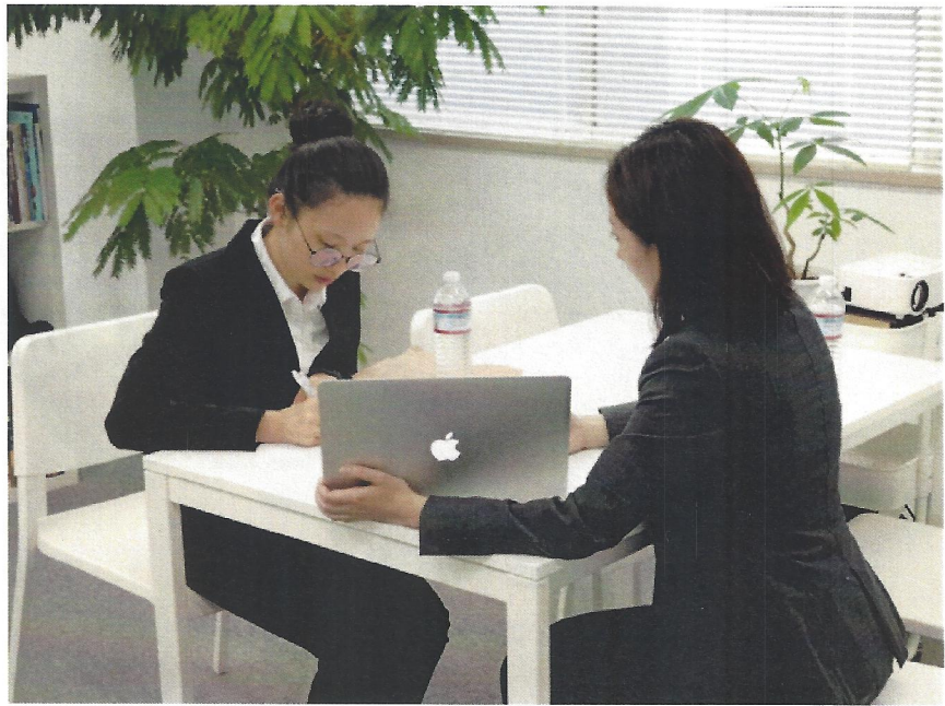
上司がキャリアデザインする様子