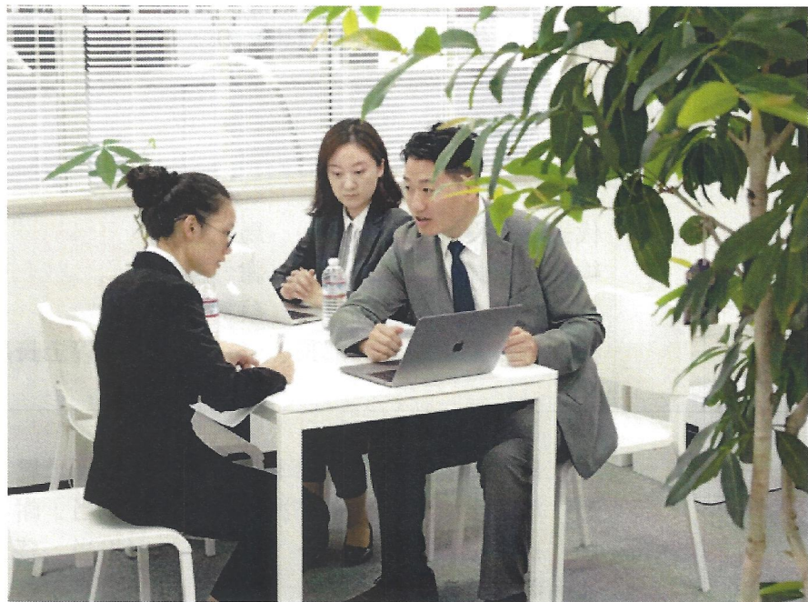
日本ビジネスマナーを教育する様子