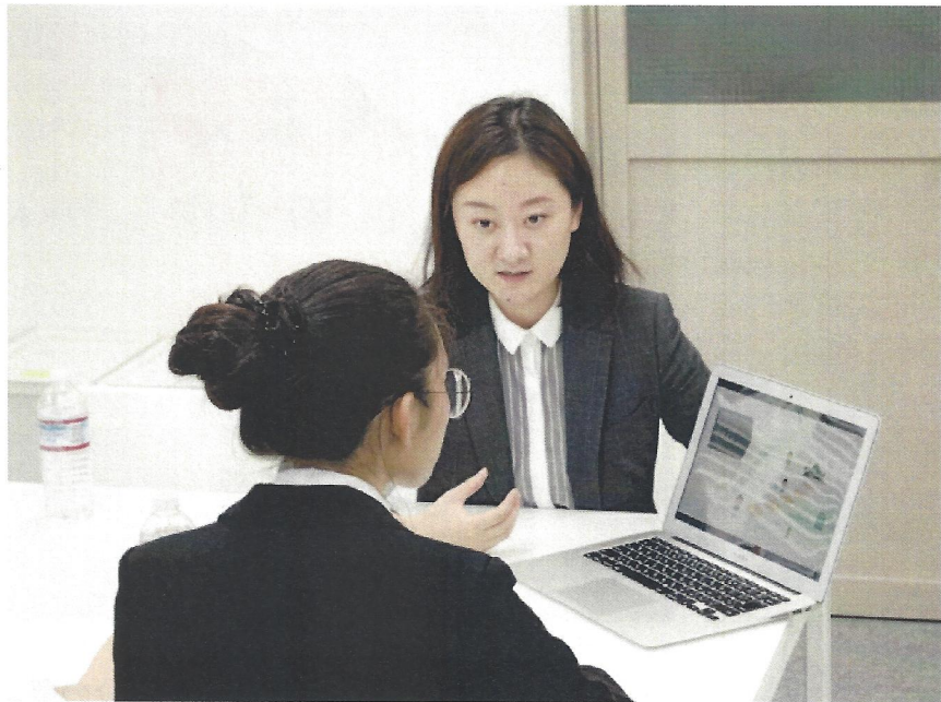
上司がキャリアデザインする様子