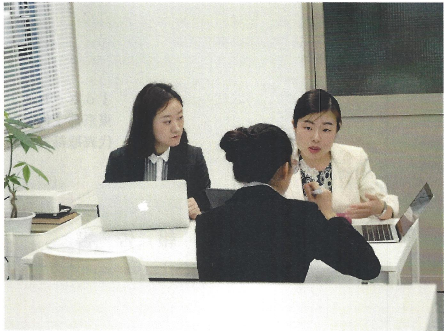
日本生活事情および注意事項を教育する様子