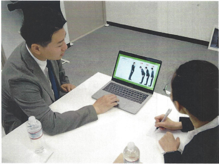
日本ビジネスマナーを教育する様子